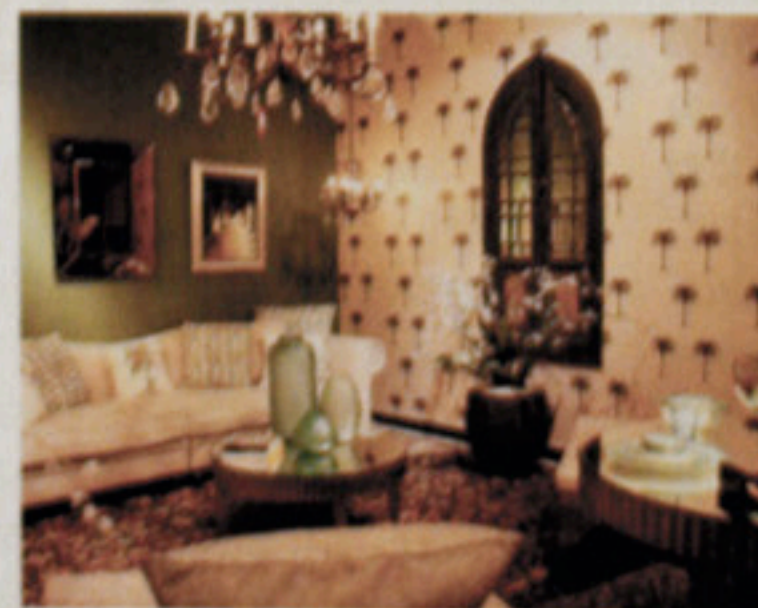
左：インドの手仕事を現代ふうアレンジした室内。クッション2,200INR、ティーポット2,800INR 右：繊細さが光るハンギング・ランタン4,200INR

3階の「アトリエ」では、それら復刻デザインとアンティークものを現代の生活に合うようにディスプレイ中。事前予約すれば、専任スタッフがコーディネート相談にもってくれる。