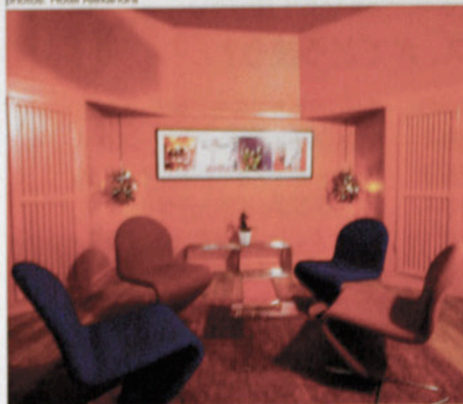
鮮やかなバントンのSチェアとスパイラル・ランプが特徴の、カラフルなインテリア。デラックス・デンリッシュ・ルーム2,545DKK