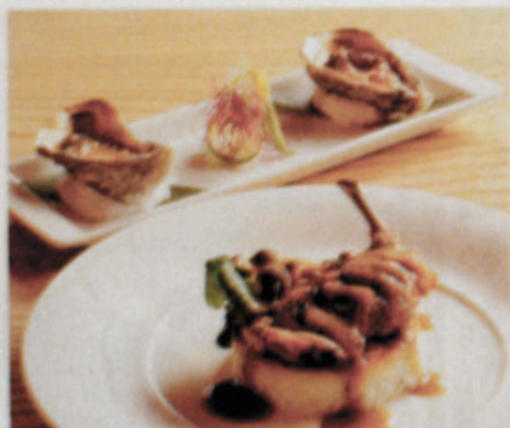
奥から：フランスから輸入した牡蠣のシソバター130元。クリスピーローズティードライス195元。冷たい料理を好まない層への北京店オリジナル料理。

客の平均単価はおよそ1,000元。リッチな顧客向けのレストランとしては代表格だ。